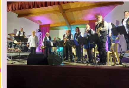
Le concert du Jam's Band