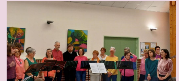
La Chorale de l'amicale laïque